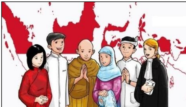
Kebhinekaan Bangsa Indonesia

Pada dasarnya keberagaman masyarakat Indonesia menjadi modal dasar dalam pembangunan bangsa. Oleh karena itu, sangat diperlukan rasa persatuan dan kesatuan yang tertanam di setiap warga negara Indonesia. Untuk mendukungnya, diperlukan persatuan yang kokoh dan kuat.