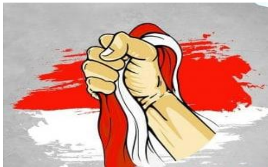
Ayo Bela Negara

Sebelum membahas lebih jauh mengenai bela negara, sebaiknya kalian memahami terlebih dahulu pengertian bela negara.