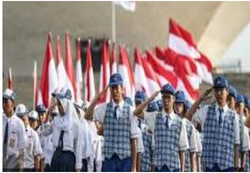
Bela Negara Pelajar