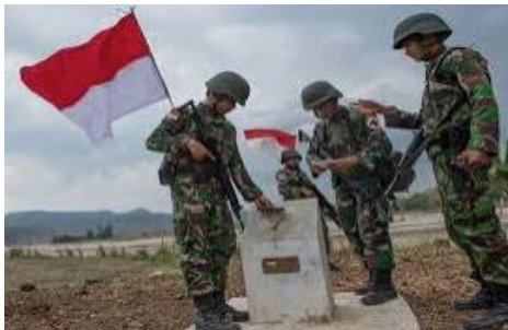
TNI Penjaga NKRI