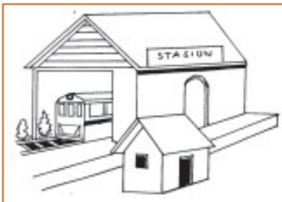
Gambar 5. 1 Stasiun