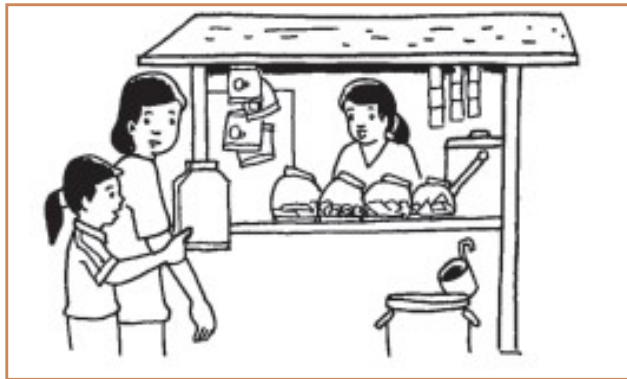
Gambar 5. 3 Maya dan Bunda pergi ke warung