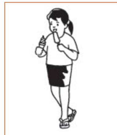
Gambar 5. 4 Maya makan es krim